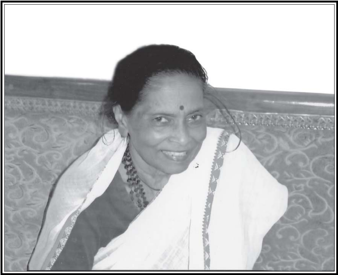
(୬ ମାର୍ଚ୍ଚ ୧୯୩୯ – ୩ ଅକ୍ଟୋବର ୨୦୧୮)