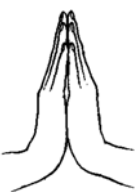
(ଚିତ୍ର : ଆତ୍ମାଞ୍ଜଳି ମୁଦ୍ରା)

ନମସ୍ତେ ବା ନମସ୍କାର ହିନ୍ଦୁଧର୍ମରେ ଏକ ପ୍ରଥାରୂପେ ପ୍ରଚଳିତ । ନମସ୍କାର କହିବା ବେଳେ ଦୁଇପାପୁଲି ଓ ଅଙ୍ଗୁଳିଗୁଡ଼ିକ ପରସ୍ପରକୁ ଲାଗିକରି ଉପର ଆଡ଼କୁ ରହେ ଏବଂ ଦୁଇ ପାପୁଲି ମଧ୍ୟରେ ସାମାନ୍ୟ ଫାଙ୍କ ଥାଏ । ବୃଦ୍ଧାଙ୍କୁଷ୍ଟି ଦୃଢ଼ ବକ୍ଷର ଖୁବ୍ ନିକଟରେ ରହେ । ମଥା ଆଗକୁ ଟିକେ ନୁଆଁଇବାକୁ ହୁଏ । ଏହାକୁ ମଧ୍ୟ ‘ଆତ୍ମାଞ୍ଜଳି ମୁଦ୍ରା’ କୁହାଯାଏ । ଏହି ମୁଦ୍ରା କରିବା ଫଳରେ ମସ୍ତିଷ୍କର ବାମ ଗୋଲାର୍ଦ୍ଧ ଓ ଦକ୍ଷିଣ ଗୋଲାର୍ଦ୍ଧ ସନ୍ତୁଳିତ ଅବସ୍ଥାରେ ରହୁଥିବାରୁ ମନ ଶାନ୍ତ ଏବଂ ଶରୀର ସୁସ୍ଥ ରହେ । ଅବଶ୍ୟ ବିନା ମୁଦ୍ରାରେ ‘ନମସ୍କାର’ କୁହାଯାଇପାରେ କିଂବା ବିନା କଥାରେ ମୁଦ୍ରା କରାଯାଇପାରେ ।