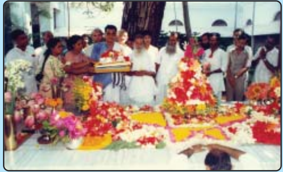
ଶ୍ରୀଅରବିନ୍ଦଙ୍କ ସମାଧି ପୀଠରେ ପବିତ୍ର ଦେହାଂଶ ସହିତ ବାବାଜି ମହାରାଜ