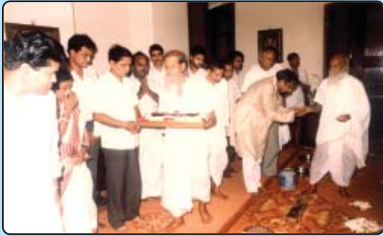
ଶ୍ରୀଅରବିନ୍ଦଙ୍କ କକ୍ଷରୁ ବାବାଜି ମହାରାଜଙ୍କ ଦ୍ଵାରା ପବିତ୍ର ଦେହାଂଶ ଗ୍ରହଣ